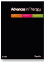
Advances in Therapy 31(7):762-775, Jul 2014