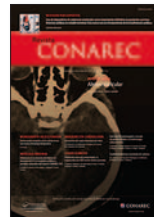
Revista del CONAREC 29(121):232-234, Sep 2013