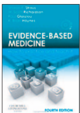
Evidence-Based Medicine 19(4): 123-131, Ago 2014