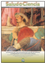
Salud i Ciencia 19(6):519-523, Mar 2013