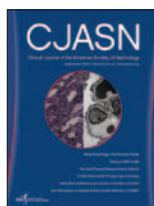
Clinical Journal of the American Society of Nephrology 10(6): 1021-1030, Jun 2015