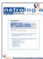
Nefrología (Madrid) 35(1):28-41, 2015