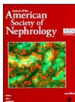
Journal of the American Society of Nephrology 26:1466-1475, 2015