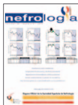
Nefrología (Madrid) 35(4):403-409, 2015