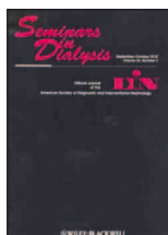
Seminars in Dialysis 28(6): 610-619, Nov 2015