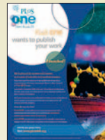
PLoS One 10(5), May 2015

◀ www.siicsalud.com/dato/resiic.php/147469