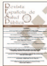
Revista Española de Salud Pública 89(2):215-225, Mar 2015

◀ www.siicsalud.com/dato/resiic.php/147701