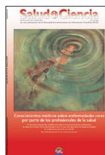
Salud i Ciencia 21(6):634-635, Oct 2015