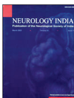
Neurology India 63(1): 63-67, Ene 2015