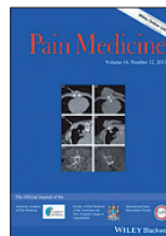
Pain Medicine, Sep 2015