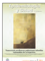
Epidemiología y Salud 1(5):32-6, Mar 2014