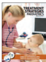
Treatment Strategies - Paediatrics 4(1):1-4, Nov 2013