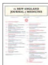
New England Journal of Medicine 370(14):1307-1315, Abr 2014