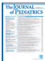
The Journal of Pediatrics 162(S1):S26-30, Mar 2013