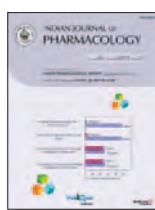
Indian Journal of Pharmacology 46(1):88-93, Ene 2014