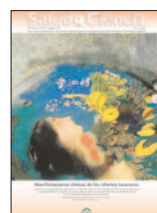
Salud i Ciencia 20(1):53-60, Ago 2013