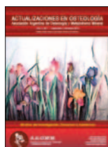
Actualizaciones en Osteología 9(3):290-291, Sep 2013