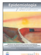
Epidemiología y Salud 2(1):11-4, Ago 2014