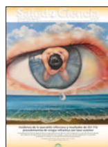
Salud i Ciencia 20(5):532-3, May 2014