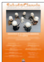
Salud i Ciencia 22(3):229-235, Oct 2016