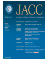
Journal of the American College of Cardiology 67(6): 630-640, Feb 2016