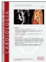
Revista Española de Cardiología 69(9):820-826, Jun 2016