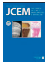
Journal of Clinical Endocrinology and Metabolism 100(4):1602-1608, Abr 2015