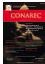
Revista del CONAREC 32(137):253-257, 2016