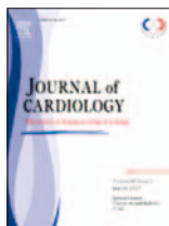
Journal of Cardiology 67(2):153-161, Feb 2016