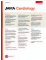
JAMA Cardiology 1-9, Feb 2017

Novedades en Cardiología resalta artículos publicados durante el bimestre anterior en el sitio siicsalud.com , el sitio oficial de la Sociedad Iberoamericana de Información Científica (SIIC). Los conceptos que acompañan a los títulos derivan hacia los artículos completos que el lector podrá consultar copiando las direcciones de sus páginas o mediante el escaneo del correspondiente CRR (Código Respuesta Rápida). Novedades en Cardiología es una publicación que integra el Programa Actualización Científica sin Exclusiones (ACISE) en Cardiología, desarrollado por la Fundación SIIC con el patrocinio de Laboratorios ARGENTIA.