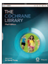
Cochrane Library (1): 1-9, 2014