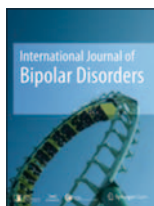
International Journal of Bipolar Disorders 3(1):2-9, Dic 2015