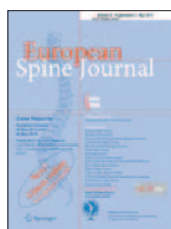
European Spine Journal 24(6):1309-1317, Jun 2015