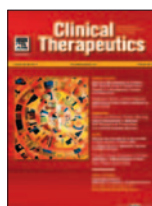
Clinical Therapeutics 37(5):1081-1090, May 2015