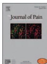
Journal of Pain Research 20(9):293-302, 2016