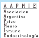
Asociación Argentina de Psiconeuroinmunoendocrinología (AAPNIE)