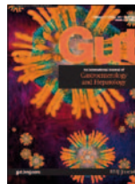
Gut 57(7): 893-902, Jul 2008