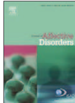
Journal of Affective Disorders 177:87-91, Ago 2015