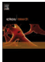
Epilepsy Research 114:13-22, Ago 2015