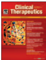
Clinical Therapeutics 38(4):874-888, Abr 2016